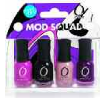
MOD SQUAD SET MANI MINI

Include nuantele: Basket Case, Black Out, Robo Romance si Hype.