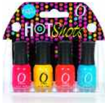
HOT SHOTS SET MANI MINI

Include indraznete nuante: Hottie, Hookup, Holla si Blue Collar.