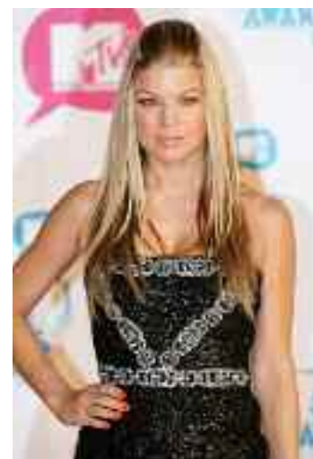
FERGIE alege adesea Orange Punch pentru ca iubeste culorile puternice. Nu ezita sa poarte culori provocatoare, indraznete, pentru a adauga un plus de sic tinutelor de gala.