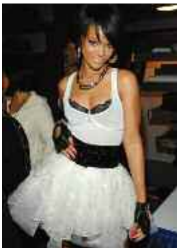
RIHANNA adora Passion Fruit pe care o adauga aici unei tinute monocrome alb-negru.