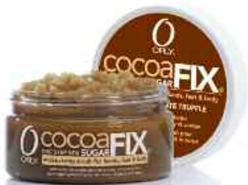
COCOA SUGARFIX exfoliant hidratant pentru maini, picioare si corp , bogata in esentele delicioase de trufe de ciocolata.

nestec exclusiv de zahar brun cu uleiuri naturale ce actioneaza delicat si le moarte ce rapesc luminozitatea, hranind pielea uscata si mentinand hidratarea la interior. Pielea este matasoasa, vasa si stralucitoare. Disponibil in 3 arome delicioase pentru o experienta aromoterapeutica deosebita.