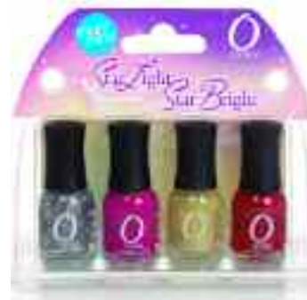
STAR LIGHT STAR BRIGHT SET MANI MINI

Include nuantele: Tiara, Hot Stuff, Groupie si Razzmatazz.