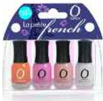
LA PETITE FRENCH SET MANI MINI

Seturile "Petite" prezinta cele mai de succes culori din colectia "Manicure Miniatures". Fiecare set, perfect compact pentru calatorie, contine 4 recipiente de 5,4 ml ideale pentru manichiura si pedichiura facute pe fuga.