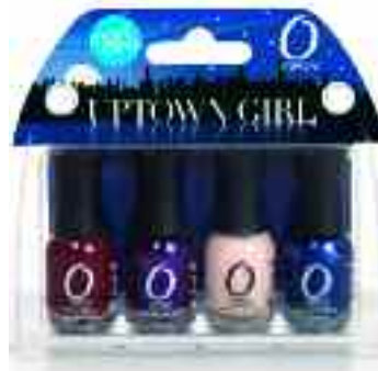
UPTOWN GIRL SET MANI MINI

Include nuantele: Ruby, Velvet Rope, Sheer Nude si Witch's Blue.