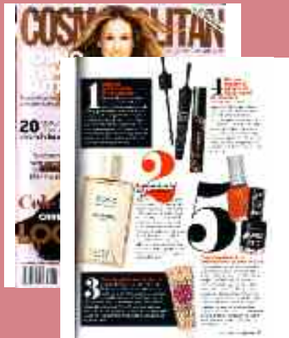
COSMOPOLITAN Romania octombrie 2010

Aici, ORLY, prin ochii presei din intreaga lume.