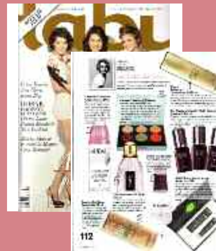
TABU Romania noiembrie 2010