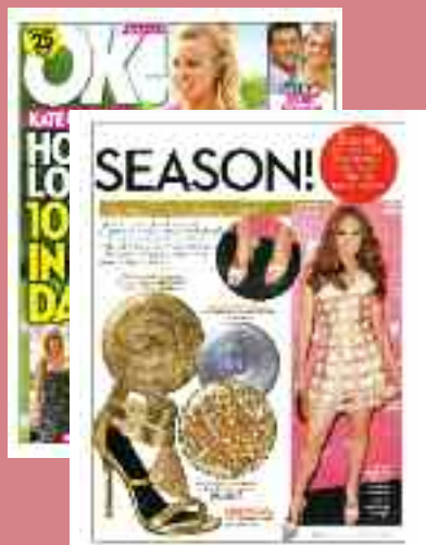
OK MAGAZINE - U.S.A Iulie 2010