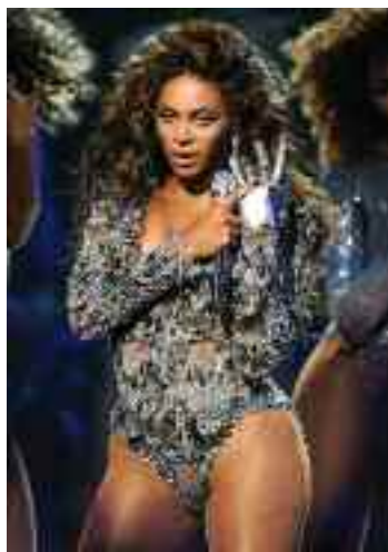
BEYONCE alege Tempress la tinutele de scena, pomind un trend: unghii lungi, elegante, in culori puternice, inchise.