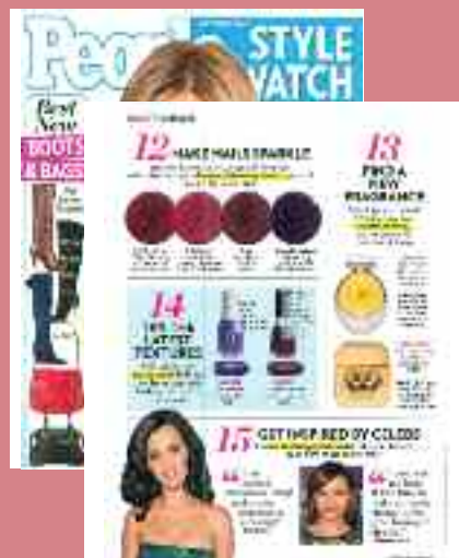
STYLE WATCH - U.S.A octombrie 2010