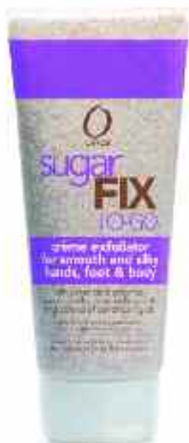
SUGARFIX TO GO crema exfolianta ionctuoasa , bogata, versiunea pe baza de crema uleioasa cu formula ORLY SugarFIX aduce cu sine o aroma dulce, usoara. Ambalat la tub pentru a fi usor de utilizat, acest produs este ideal pentru calatorii.