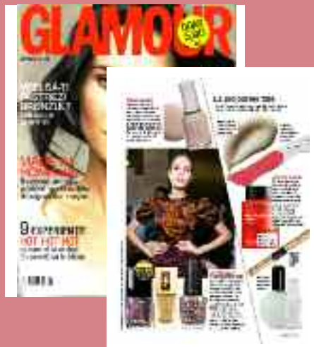
GLAMOUR Romania septembrie 2010