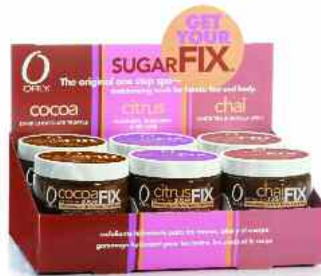
SUGARFIX SET de 12

Relansati vanzarile si castigati vizibilitate cu acest stand compact. Include 4 buc. din cele 3 delicioase arome.